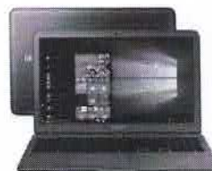
Notebook Samsung Expert X50 Intel Core i7 8GB 1TB

de R$5.499,00 por R$4.464,05 à vista ou R$ 4.699,00 10x de R$ 469,90 sem juros