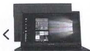
Notebook Positivo Motion Red Q232B Intel Quad

de R$1.299,00 por R$1.234,05 à vista ou R$ 1.299,00 10x de R$ 129,90 sem juros