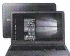
Notebook Samsung Expert X55 Intel Core i7 16GB -

de R$1.299,00 por R$1.234,05 à vista ou R$ 1.299,00 10x de R$ 129,90 sem juros