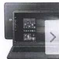
Notebook Samsung Essentials E30 Intel (

de R$4.499,00 por R$3.799,05 à vista ou R$ 3.999,00 10x de R$ 399,90 sem juros